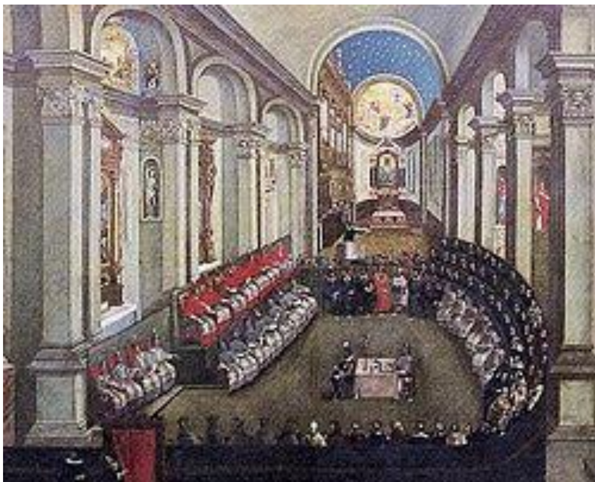
Concilio de Trento

Vaticano II: No se pronunció sobre la comunión en la mano (auto-comunión).