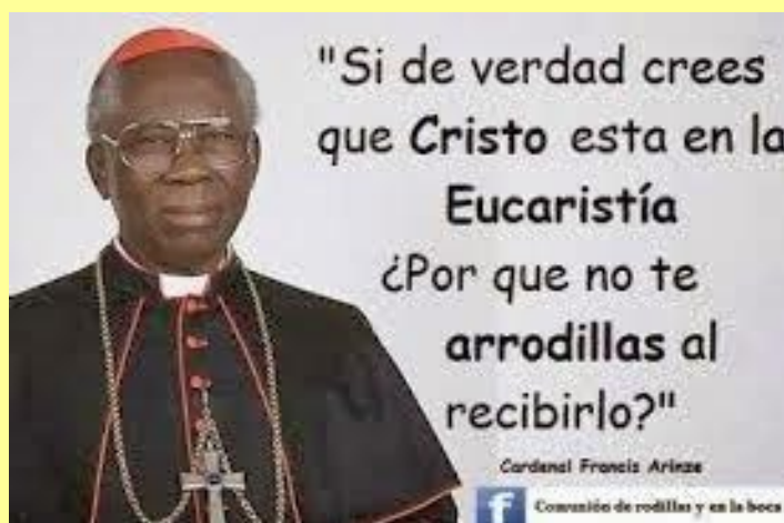
Imagen: Cardenal Francis Arinze, de Nigeria