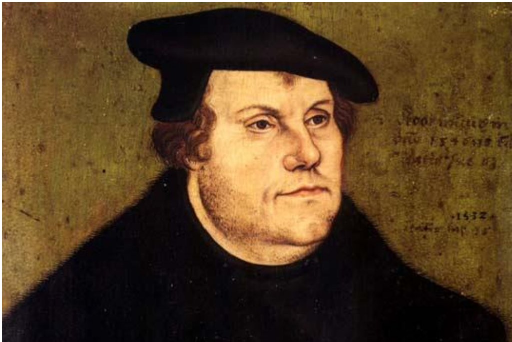
El reformador Martín Lutero

Visto que en Alemania celebrarán en octubre de 2017 el 500º aniversario del nacimiento del protestantismo y por ende, los homenajes a Martín Lutero por las autoridades locales, la Iglesia Católica con el Papa a la cabeza se sumará al evento en un acto conjunto con las autoridades religiosas protestantes en Suecia. Es por ello que queremos presentar estas evidencias que lo comprueban, de que Martín Lutero SE ENCUENTRA CONDENADO EN EL INFIERNO.