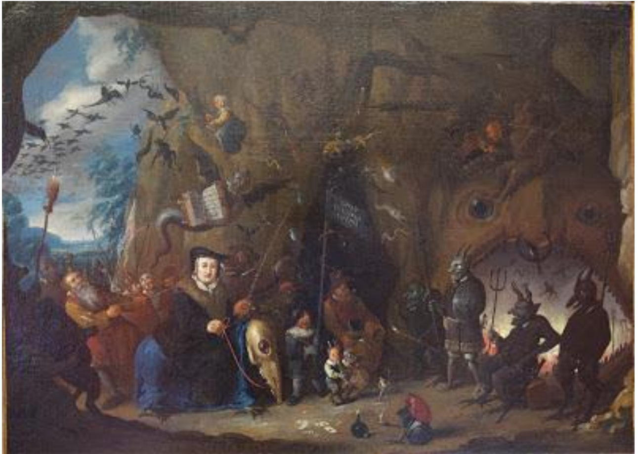
Entrada de Martín Lutero en el Infierno

La monja pensaba: si el público allí presente viera esta escena dramática, ciertamente no rendiría honores, memoria, conmemoraciones ni celebraciones a tal personaje. Así, cuando se le presentaba la oportunidad le recordaba a sus hermanas de religión sobre el deber de vivir en la humildad y el abandono de sí. Estaba convencida firmemente que Martín Lutero estaba condenado en el infierno sobre todo por el primer pecado capital: LA SOBERBIA. El orgullo lo hizo caer en pecado mortal, y lo condujo a la rebelión abierta contra la Iglesia Católica, su mala conducta moral, su actitud de rebeldía contra el Papado y su predicación de doctrinas erróneas pesó mucho en el desvío de muchas almas superficiales y mundanas que cayeron en la perdición eterna. Su conducta, su posición para con la Iglesia y su predicación fueron determinantes para engañar y conducir a muchas almas superficiales e incautas a la eterna ruina.