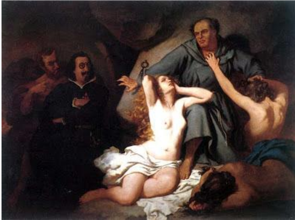
Francisco de Quevedo viendo a Martín Lutero en el Infierno

Al cabo estaba el maldito Lutero con su capilla y sus mujeres, hinchado como un sapo y blasfemando. (...)Válgame Dios, dije llegándome a Lutero, ¿cómo ah, mal hombre -por no decir: cómo, ah, mal fraile-, te atreviste a decir que no se habían de adorar las imágenes, si en ellas no se adora sino la espiritual grandeza que a nuestro modo representan? (...). Dices también que Cristo pagó por todos y que no hay sino vivir como quisiéramos, porque El que me hizo a mí me salvará a mí sin mí; bien, me hizo a mí sin mí, pero, hecho, siente que yo destruya su obra y manche su pintura y borre su imagen. Y si, como confiesas, sintió en el primer hombre tanto un pecado que, por satisfacerle mostrando su amor, murió, ¿cómo te dejas decir que murió para darnos libertad de pecar quien siente tanto que pequemos? Y si murió y padeció Cristo para enseñarnos lo que cuesta un pecado, y lo que hemos de huirle ¿de dónde coliges que murió para darnos licencia para hacer delitos? Que satisfizo por todos es verdad, luego, ¿no tenemos que trabajar nosotros? ¡Mientes!, pues hay que trabajar en no caer en otros y en pagar los cometidos delitos(...). Espantome, Lutero, de que supieses nada. ¿De qué te aprovecharon tus letras y agudeza?