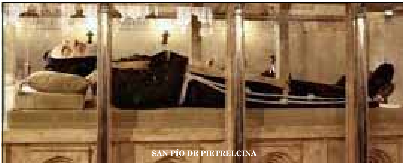
SAN PÍO DE PIETRELCINA

tros, la del publicano: ¡Dios mío, ten piedad de mí, que soy un pecador! (Lc 18:13).